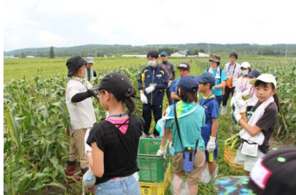
収穫体験（小笠原農場）

(2) 交流人数 中土佐町 15名 幕別町 10名（※町内小学生4～6年生） 幕別清陵高校生徒 3名