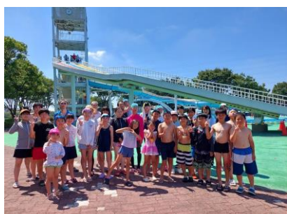
大和田公園プールにて