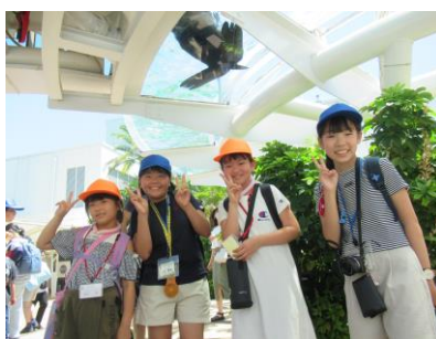
サンシャイン水族館にて