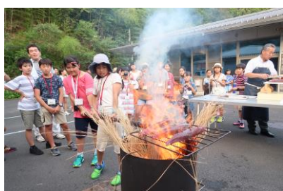
カツオのたたき作り