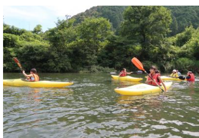
四万十川カヌー体験