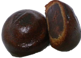
とちだいふくほんぽ こくとう <十勝大福本舗さんの黒糖まんじゅう>

25日 ごはん、牛乳 ぎゅうにゅう なが なが いものみそ汁 しる さんまのおかか煮 に どろ豚 ぶた のしょうが焼き や