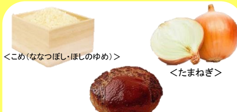
<こめ(ななつほし・ほしのゆめ)>

27日 忠類和牛 ちゅうるいわぎゅう のロコモコ丼 どん オニオンスーフ ラ・フランスゼリー ぎゅうにゅう 牛乳