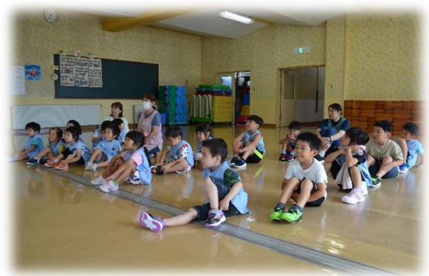
8月18日（金）2学期の始業式にて

11月の発表会をはじめ、様々な行事が計画されています。保護者の皆さんには2学期も何かとご協力をお願いすることが多くなると思いますが、どうぞよろしくお願いいたします。