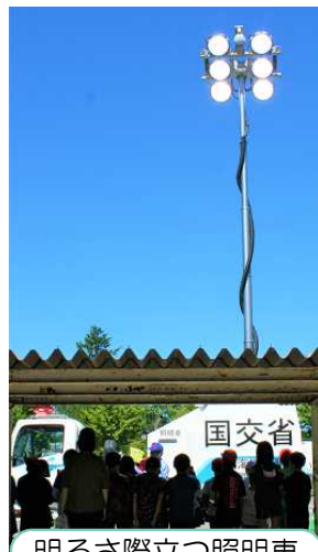
明るさ際立つ照明車

多くの皆様にお力添えをいただき、体験を通じた意義ある学びができました。関係機関の皆様、ありがとうございました。