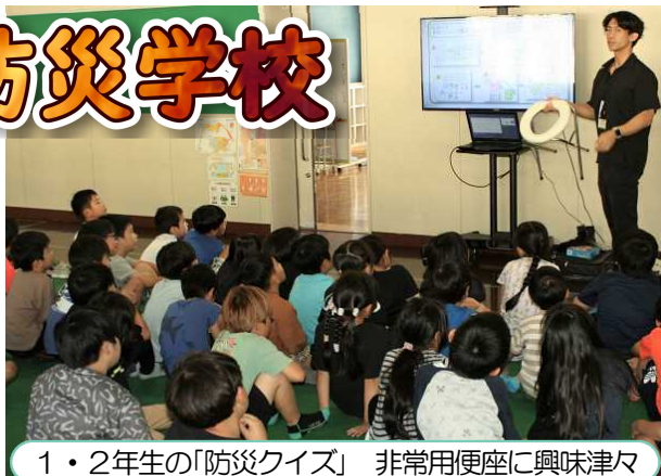
1・2年生の「防災クイズ」 非常用便座に興味津々