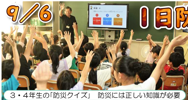
3・4年生の「防災クイズ」 防災には正しい知識が必要