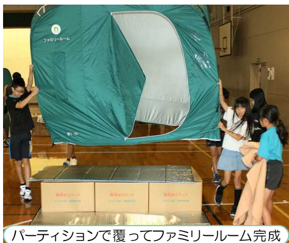
パーティションで覆ってファミリールーム完成

として、高学年が設営したファミリールームで段ボールベッドの寝心地を確かめていました。