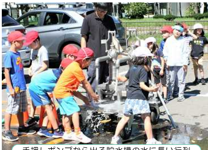
手押しポンプから出る貯水槽の水に長い行列

また、屋外では、駐車場の地下に設置されている耐震性貯水槽について町役場防災環境課の方から説明を聞き、災害等で断水になったときにも発電機や手押しポンプを使って飲料水が確保できることを全学年の子どもたちが知りました。さらに、駐車場には北海道開発局の協力で、防災車両の照明車が展示されました。帯広開発建設部防災課の方から、照明は