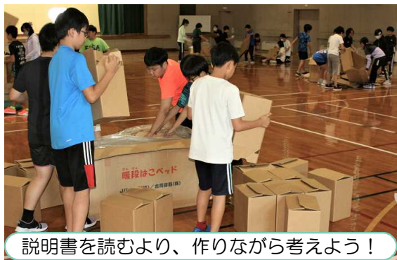
説明書を読むより、作りながら考えよう！