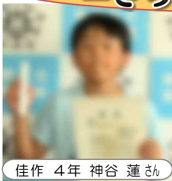
第48回おびひろ動物園 動物画写生コンクール (7/6)