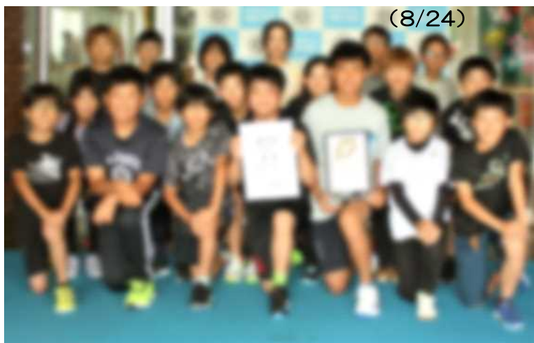
優勝 幕別野球少年団