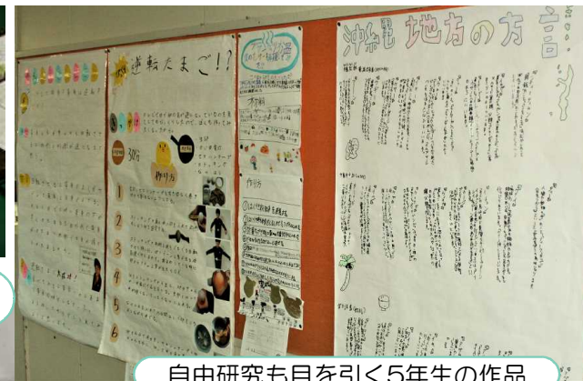
自由研究も目を引く5年生の作品