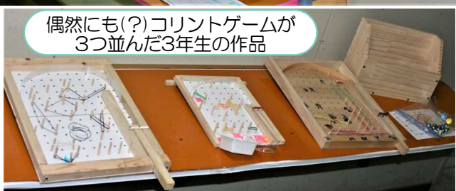
偶然にも(?)コリントゲームが 3つ並んだ3年生の作品