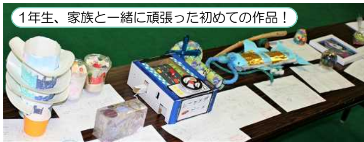
1年生、家族と一緒に頑張った初めての作品！