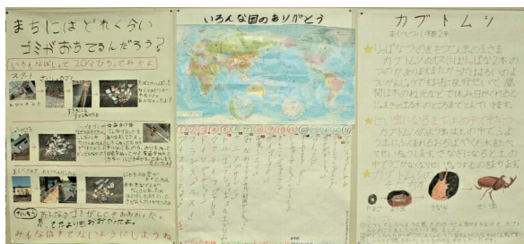
よく調べた！ 上手にまとめた！ 2年生の自由研究