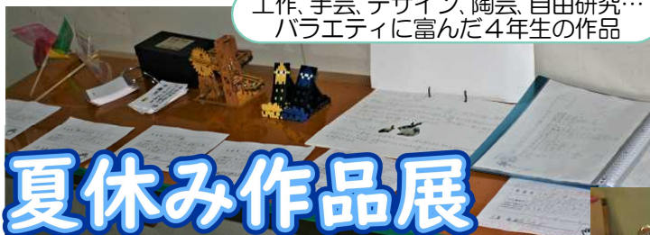
工作、手芸、デザイン、陶芸、自由研究… バラエティに富んだ4年生の作品