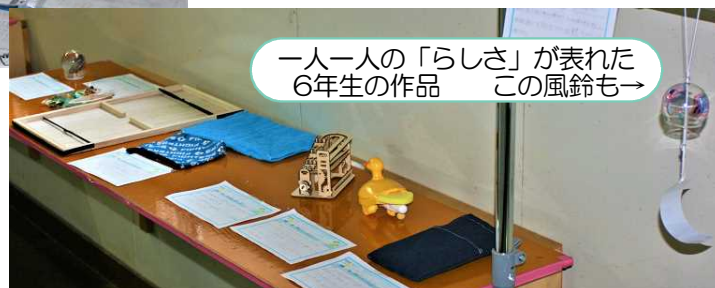
一人一人の「らしさ」が表れた 6年生の作品 この風鈴も→

教室前などに展示された夏休みの作品。一つ一つが興味深い作品で、見ていると時間がたつのも忘れてしまいます。また、ここに並ぶまでのいろいろなドラマも想像してしまいました。ご家族の皆さん、重ね重ねありがとうございました。