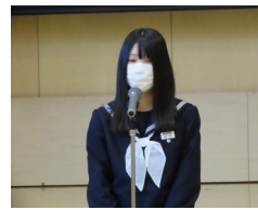
始業式では、生徒会と学年の代表が3学期の決意を述べてくれました