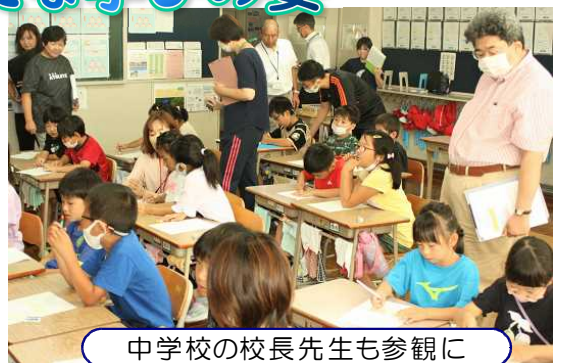
中学校の校長先生も参観に

子どもたちに確かな資質・能力を育むためには教員による授業の改善が必要です。本校ではその視点を明確にした授業を互いに見合い、検証し合っています。13日にその1回目が行われ、主体的に学ぶ2年生の姿を通して、授業後の教員の研究協議も熱を帯びていました。2学期も他の学年や特別支援学級で授業を見合い、教員も新たな学びを継続します。11月には小中合同の研修会も予定しています。