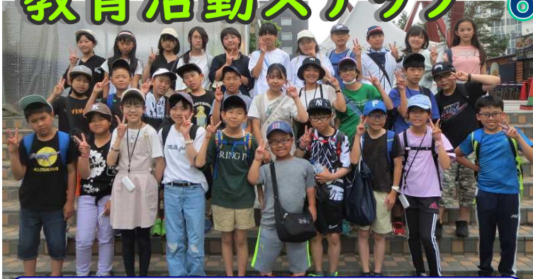
テレビ塔の下で31人の集合写真 このあと自主研修に

運動会前から計画を進めていた修学旅行。1日目は、7時前に学校を出発し、バスで小樽市へ向かいました。小樽ではオリジナルグラスの制作体験のあと、自主研修や水族館見学をして、定山溪のホテルに入りました。ピュッフェの夕食やプールで非日常を味わい、それぞれの部屋でも友だちとの楽しい時間を過ごしていたようです。