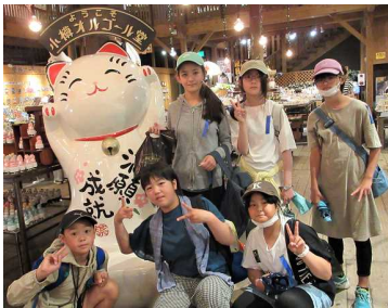
1日目 小樽での自主研修

運動会前から計画を進めていた修学旅行。1日目は、7時前に学校を出発し、バスで小樽市へ向かいました。小樽ではオリジナルグラスの制作体験のあと、自主研修や水族館見学をして、定山溪のホテルに入りました。ピュッフェの夕食やプールで非日常を味わい、それぞれの部屋でも友だちとの楽しい時間を過ごしていたようです。