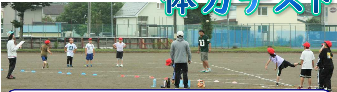
中学校のグラウンドで3年生がボール投げの測定