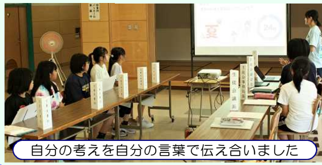
自分の考えを自分の言葉で伝え合いました

13日の昼休みに、中学校で児童会と生徒会の役員交流会がありました。それぞれの活動を紹介し、よりよい活動にするための意見が交換されました。改めて児童会役員5人の意識の高さが発揮された場面でした。