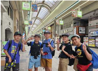
2日目 札幌での自主研修

2日目は、札幌で7つのグループに分かれて6時間の自主研修でした。地下鉄を利用しながら動物園や札幌ドーム、白い恋人パークなど、どのグループも事前の計画をしっかりと実行することができました。