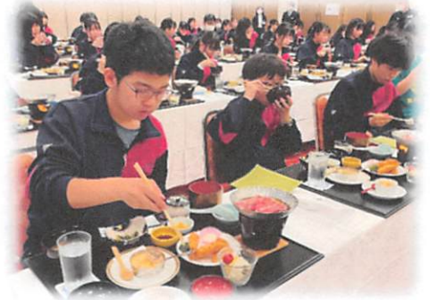
2日目：北斗市～岩手県盛岡市～平泉