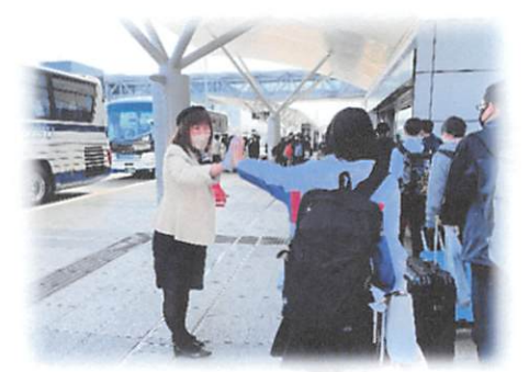
4日目：宮城県仙台市～新千歳