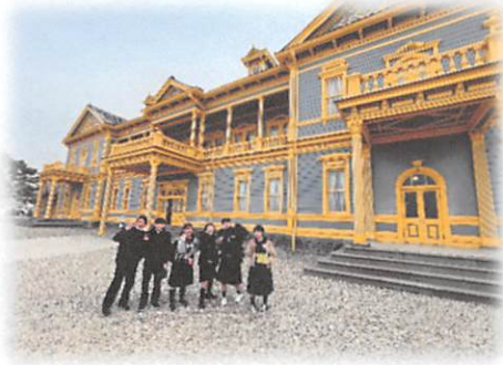
1日目：函館市～北斗市

4月25日～28日、3年生が3泊4日の修学旅行に行ってきました。保護者の皆様のご理解とご協力、旅行業者や宿泊施設のご尽力、町教育委員会による助成等、多くの方々のおかげで無事に実施することができました。生徒たちにとって「最も思い出に残る行事」となる修学旅行に行くことができたことは、本当に嬉しいことです。好天にも恵まれ、旅行先でお世話になった全ての方々に感謝いたします。そのときの様子について、ごく一部ですが写真で紹介いたします。