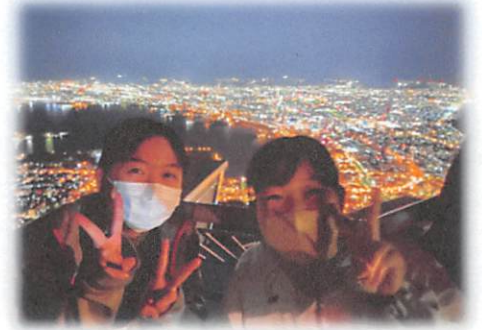
1日目夜：函館山からの夜景