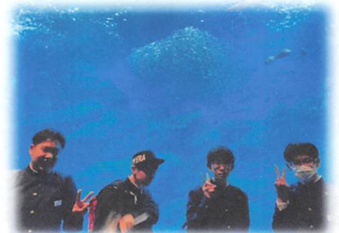
3日目：平泉～気仙沼～宮城県仙台市