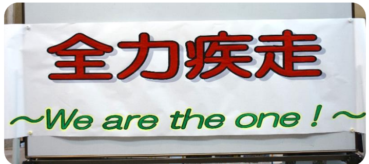
運動会テーマ「全力疾走」

コロナ禍後初の運動会、「良かった」と思っただけの初夏のひと時をみなさまと共に過ごすことができればと思っております。