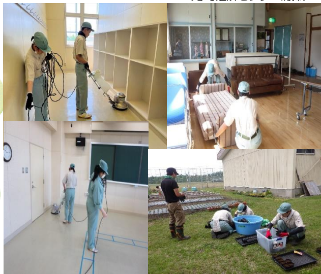
(校内のワックス掛け)