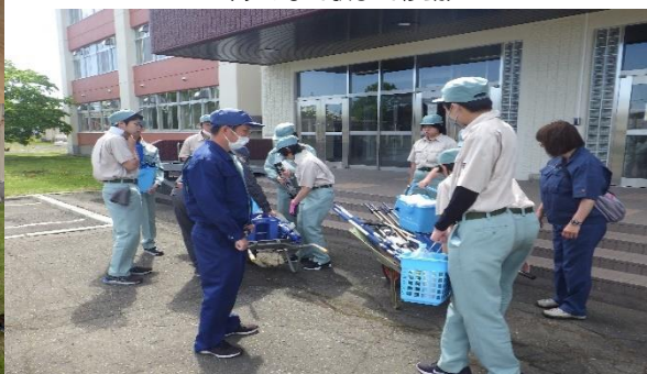
(みんなで駅まで移動)