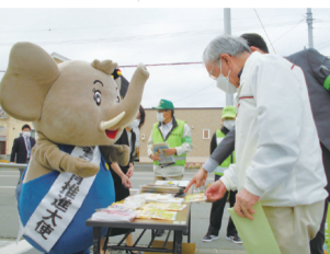
▲消費者教育推進大使のパオくんとかまゲラクくん

「特殊詐欺・振り込み詐欺未然防止」啓発活動を実施 10月14日(金)午前9時から、幕別町消費者被害防止ネットワークの構成メンバー22人が町内金融機関前で、「特殊詐欺に気を付けて」と啓発グッズを配りながら注意を呼び掛けました。