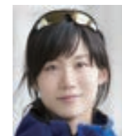
高木美帆さん バンクーバー・平昌・北京五輪出場 平昌五輪で金メダル2個獲得 北京五輪で銀メダルを獲得 スピードスケート選手