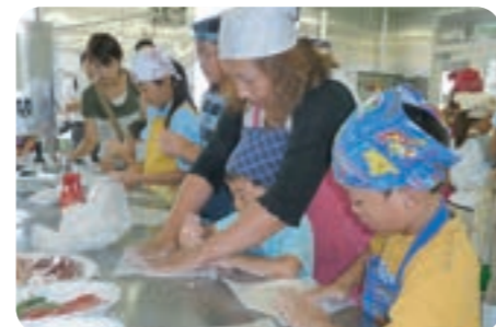
「ふるさと味覚工房」では、味噌やアイスクリーム、パンづくり体験ができます。