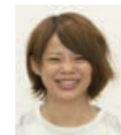
高木菜那さん ソチ・平昌・北京五輪出場 北京五輪で銀メダルを獲得 平昌五輪で金メダル2個獲得 スピードスケート選手