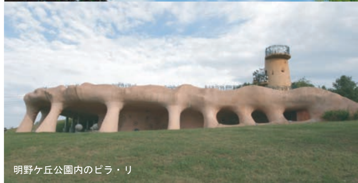
明野ヶ丘公園内のピラ・リ