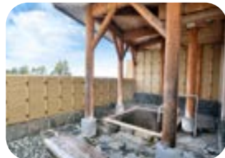
町内に温泉がいくつもあり、美肌の湯として知られています。