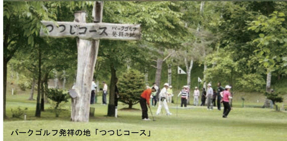
パークゴルフ発祥の地「つつじコース」