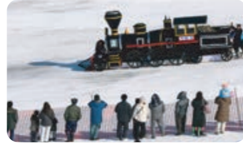
ダンボールなの？全道ナウマンそり大会

ダンボール製のオリジナルそりでスキー場を滑降り、そのデザインとスピードを競います。ダンボールとは思えないユニークなそりとパフォーマンスが爆笑を誘うイベントです。