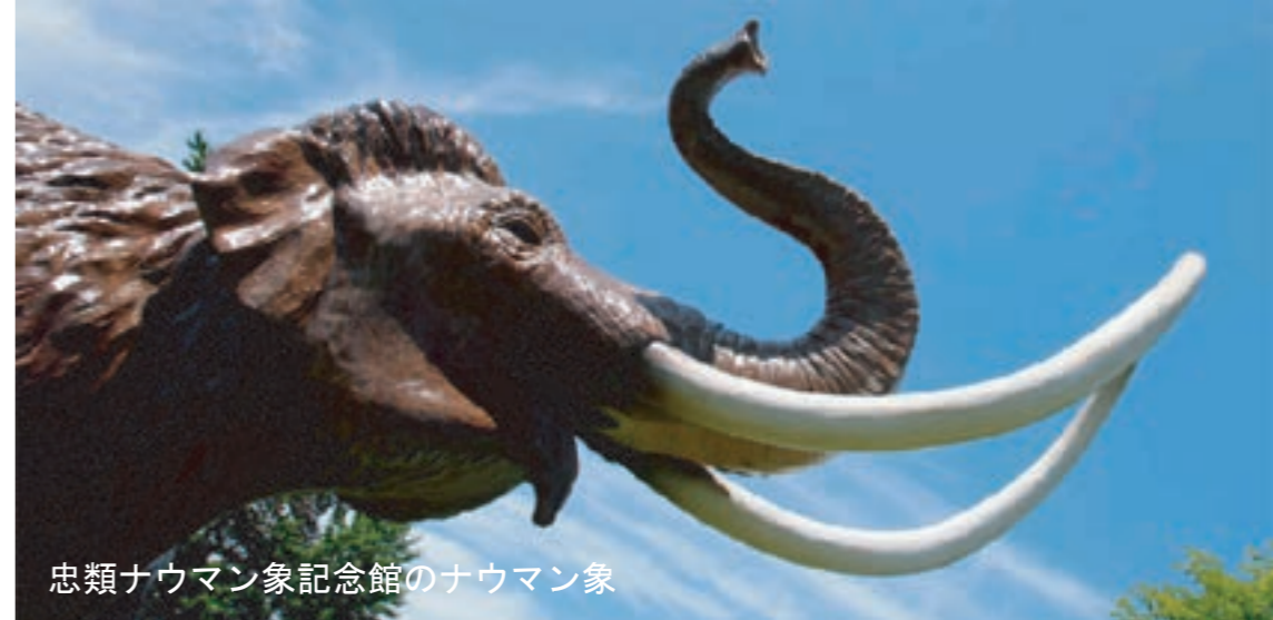
忠類ナウマン象記念館のナウマン象