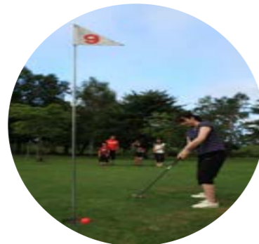
幕別町発祥のスポーツである「パークゴルフ」緑豊かな風を感じながら楽しめます。