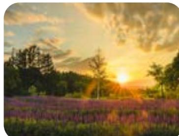
美しい庭園とマンガリツァ豚が見どころの「十勝ヒルズ」