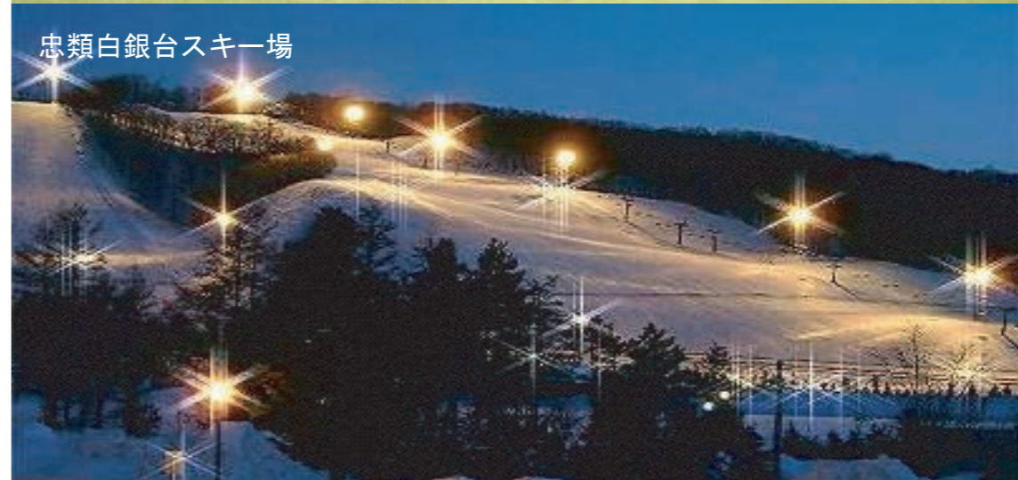
忠類白銀台スキー場