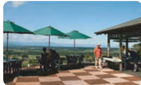
夏季限定！忠類のシーニックカフェからの眺めは壮大です。

幕別地区・忠類地区で開催される、年に一度の収穫祭。歌謡ステージあり、アトラクションありの北海道の魅力がたっぷりつまったお祭りです。