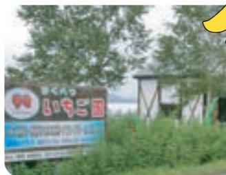
まくべついちご園でいちご狩り。摘みだての甘い味を堪能してください。