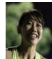
福島千里さん 北京・ロンドン・リオ五輪出場 陸上女子100m・200m 日本記録保持者

町の魅力を国内外に広くPRしてもらい、町の知名度およびイメージ向上を図るため、幕別町出身のオリンピックの方を応援大使に委嘱しています。