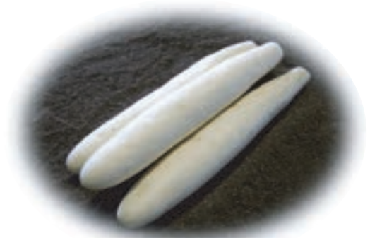
幕別町農協の長芋選果場で偶然発見された毛のない長いも「和稔じよ」