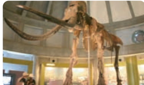
忠類地区のナウマン象記念館。大迫力の全身骨格がお出迎えます。