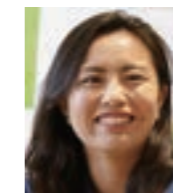
桑井亜乃さん リオデジャネイロ五輪出場 7人制ラグビーでオリンピック 日本人初トライ・初得点をマーク