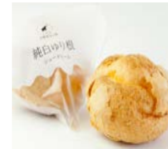
独特な風味がクセになる「純白ゆり根シュークリーム」