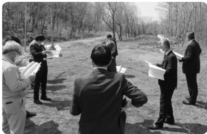
（宇依田道路整備予定箇所）

道道幕別帯広芽室線の整備について 帯広圏域環状線として整備される道道幕別帯広芽室線について説明を受け、道路整備予定箇所などの現地調査を行いました。