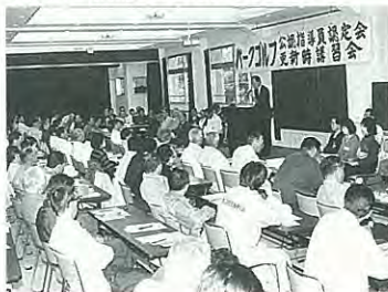
真剣に講義を受ける参加者

技研修に真剣に取り組み、百五十一人が指導員に認定され、五十九人が三年に一度の指導員更新をされました。