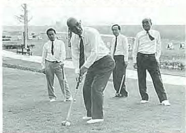
5月21日開成町から町長ら来町

ど、十三の市町村がすでに視察に訪れています。パークゴルフの魅力とコースの整備に、視察に訪れたみなさんは感動の連続。ますます広がるパークゴルフの“和”発祥の地、幕別町を訪れる人に誇れる、マナーとルールに心がけましよう。