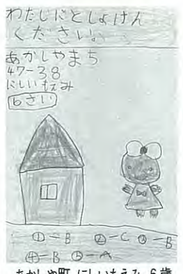
あかしや町 にいもえみ 6歳