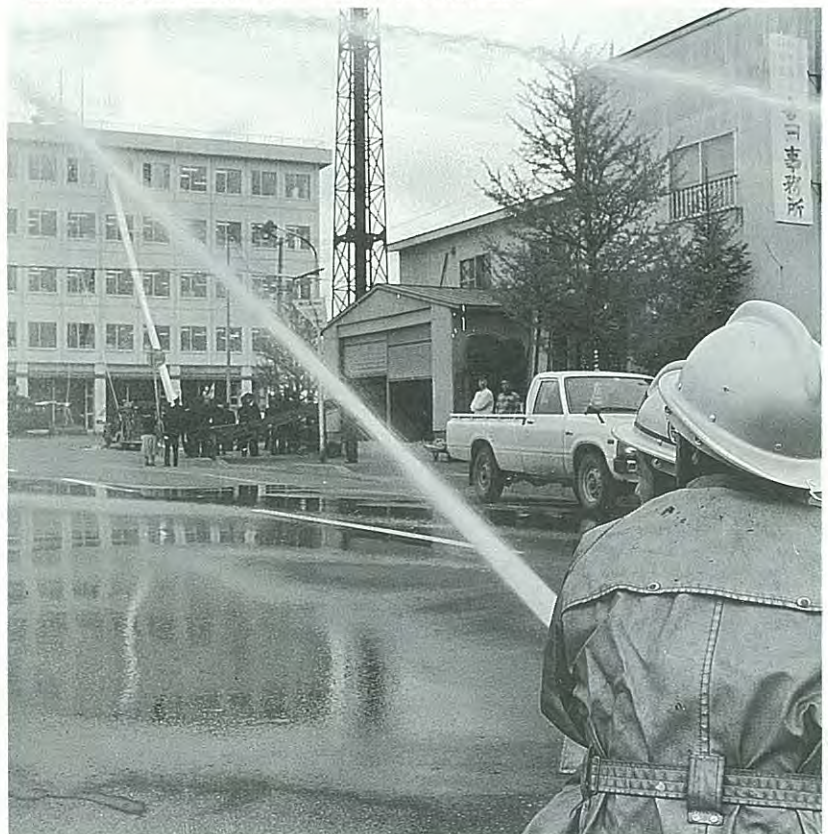
役場庁舎が火事と想定し、一斉放水する消防団員

模擬火災訓練では、役場庁舎2階より出火したと想定し、消火活動と同時に、出火階上部者の避難誘導及び救助活動を開始。団員は機敏な動作で訓練にのぞんでいた。