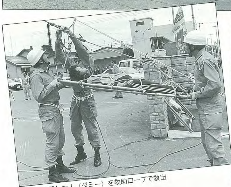
屋上に避難した人（ダミー）を救助ロープで救出