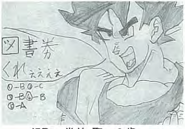
緑町 堂前 聖 8歳

◎…三年生になって初の「学力」が終わった。一息つくうと思つたら「中間」だ。月に二回もテストやらせん。テストのバカ野郎↓PN Bz大好き(春日町・15歳) ♥…おこるな、ぼやくな。明るい未来は目の前だ…。