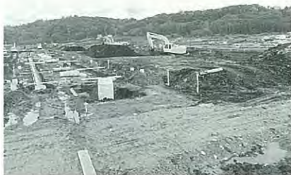
造成工事中のリバーサイド幕別

上下水道完備、環境、地理的条件に恵まれた団地ということで、問い合わせも多いことから、今年度中には完了できると期待されています。