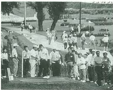
第5回 パークゴルフ国際大会の様子

※他町村からの参加が増えることが予想されます。したがって、応募多数の場合は抽選により決めさせていただきます。