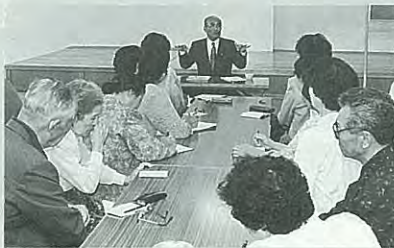
30日…青空懇談会（糠内駒島方面）