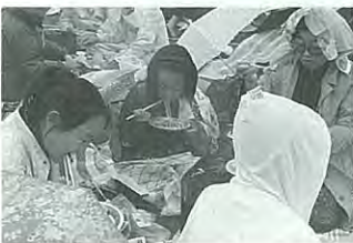
雨のしずくがまた格別。焼き肉をおいしくしてくれます