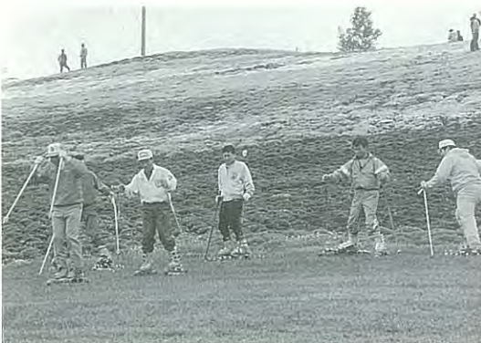
夏場のスキー場活用にとグラススキーのデモンストレーションも行われた

六月七日、八回目を数えた今年の芝桜まつりは小雨交じりの悪天候で始まった。五万株の芝桜はちょうど見どころ、と集まった五千人で会場は傘の花が満開。雨にもマケズ、寒さにメゲズ、焼き肉とビールをほおばっていました。 この熱気に押され、カラオケ大会、歌謡ショーの始まるころ雨も吹き飛ばされ、まつりムードは盛り上がりました。