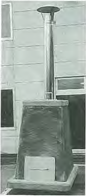
町内の日専産業で製作