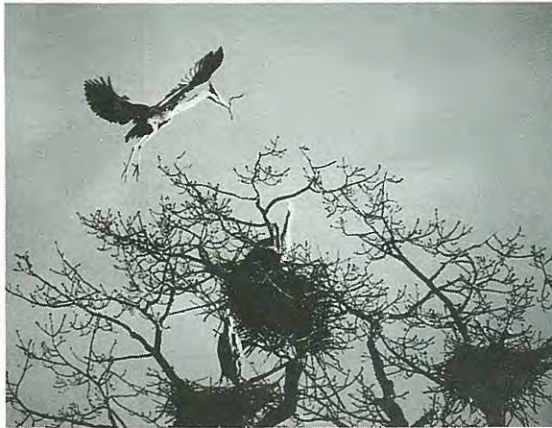
アオサギの子育ての様子(猿別 金刀比羅山)