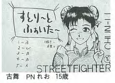
古舞 PNれお 15歳