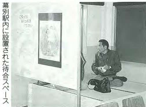
幕別駅内に設置された待合スペース