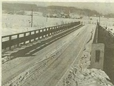
昭和41年ごろの吐月橋。橋は昭和39年に完成したものです。