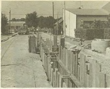
順調に進む下水道工事(緑町)