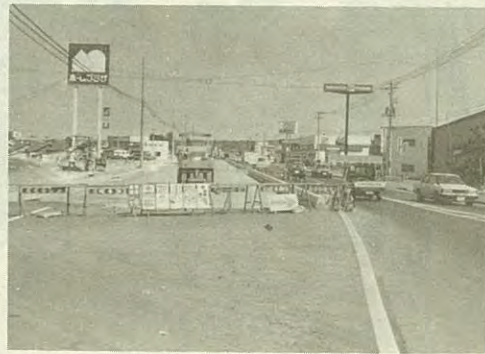
拡幅工事が進む国道38号線