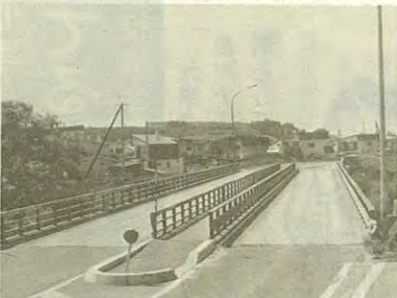
現在の吐月橋付近。一面の畑が現在は南あかしや団地になっています。