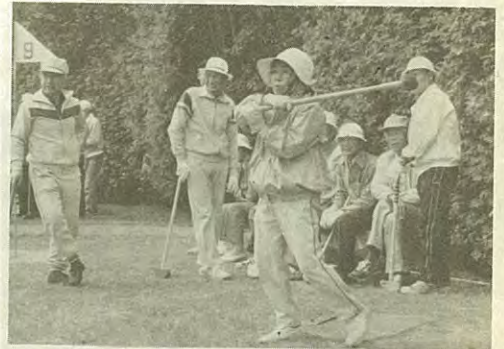
今後も普及が期待されるパークゴルフ

農村地域社会の建設を目標に、土地の有効利用と高生産性農業の展開を図り、近代的、合理的な農業経営の確立に努める。