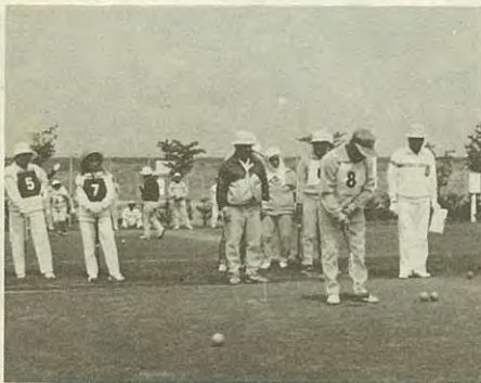
老人のスポーツとして定着したゲートボール