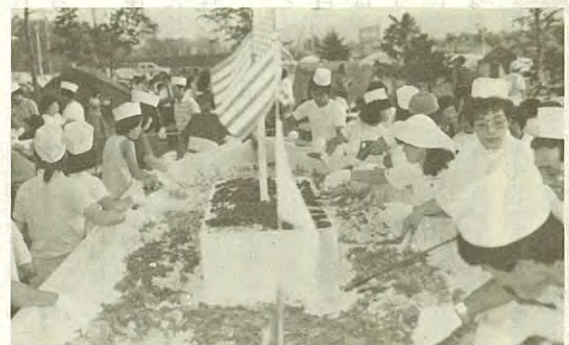
昨年のジャンボカレーライス1,000人分

昭和十年九月に岡山県倉敷に生まれる。奥さんと二人暮らし。北陸製薬道東販売株式会社社長。