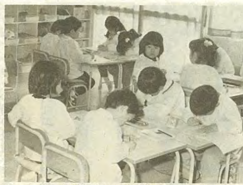
町立わがば幼稚園で元気に学ぶ園児たち