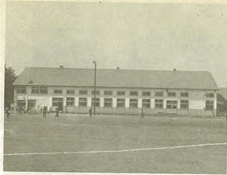
老朽化が著しい幕別中学校体育館

意ある教育を實踐する。 ● 学校の適正配置及び通学区域の見直しをする。 ● 老朽校舎などの改善を促進する。