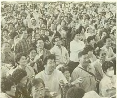
町の一大会として定着した産業まつり