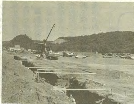
現在造成中の札内東工業団地

● 既存工場工業の育成を図る。 ● 先端技術産業や関連産業の積極的な誘致を促進する。