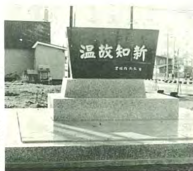
完成した開拓記念碑