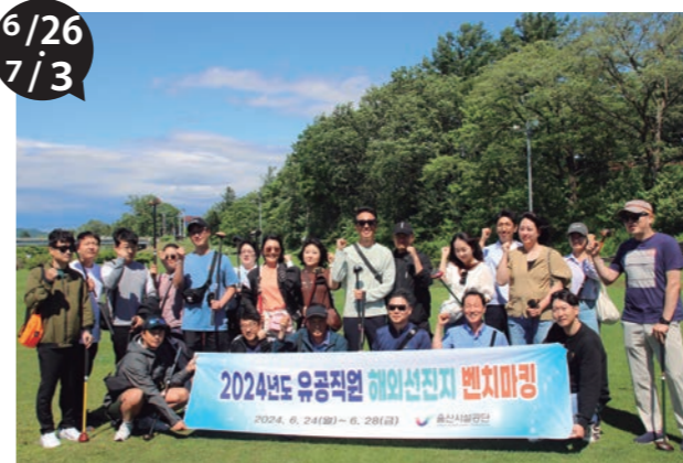
ウルサン 韓国蔚山広域市より施設公団職員が視察来町