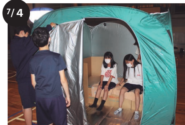
札内東中学校 1日防災学校