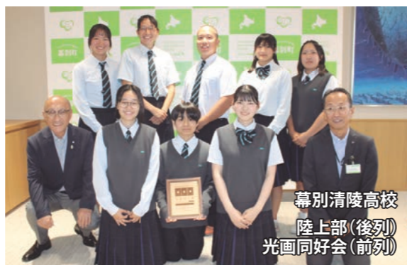
幕別清陵高校 陸上部(後列) 光画同好会(前列)