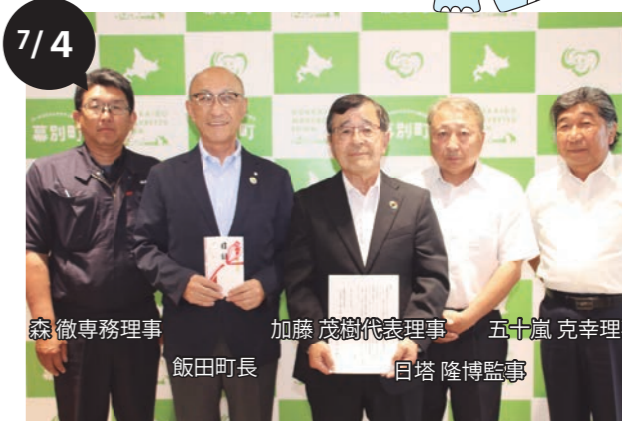
南十勝夢街道シーニックカフェちゅうるい