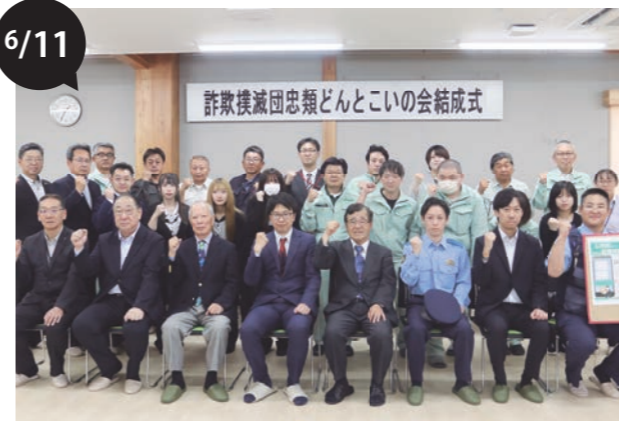
詐欺撲滅団・忠類どんとこいの会