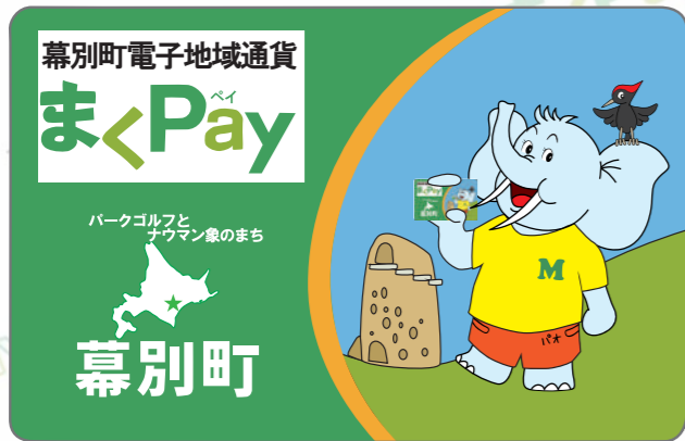
電子マネー：チャージできる

事業開始時にチャージ額の30%分のプレミアムポイント（電子マネー）を付与するキャンペーンを実施することで、多くの方に利用してもらえる電子地域通貨を目指します。