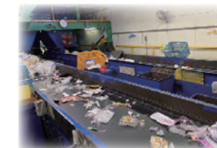
資源ごみの分別作業の様子