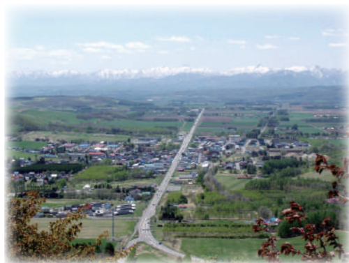
▲丸山展望台からの眺め

私はそんな丸山の魅力にひかれ、SNSでその姿を月に1回紹介したこともありました。ある場所からは丸い形に見え、場所を変えると台形のような形に、またある場所からはなだらかな円すい形に…。神秘的な魅力を秘め、ロマンあふれる黄金伝説が語り継がれる山。