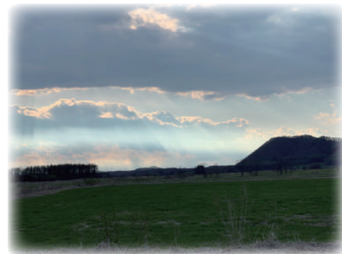
▲丸山にさすエンジェルラダー

その山は標高 271 メートルです。 さほどの高さではありませんが、数字以上の存在感があります。 忠類地域のほとんどの場所から臨むことができ、地域のランドマーク です。