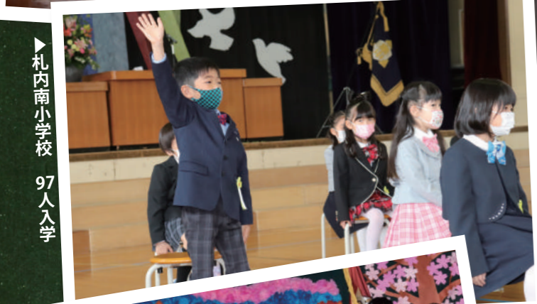
▶ 札内南小学校 97人入学