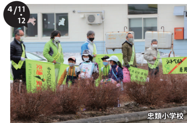
交通安全街頭啓発