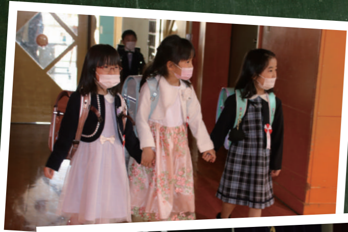
◀ 白人小学校 38人入学

4月8日(金)、11日(月)、町内全9校の小学校で入学式が行われました。今年は全校合わせて206人の新1年生が入学。喜びに満ちた笑顔やちょっぴり緊張した横顔など、色々な表情を見せてくれました。