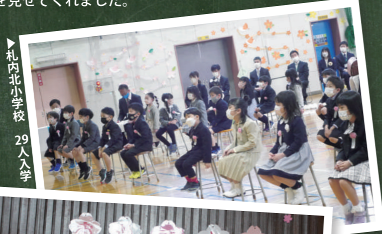
▶ 札内北小学校 29人入学