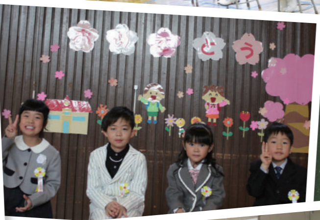
◀ 古舞小学校 4人入学