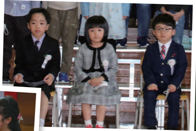
▲ 糠内小学校 3人入学