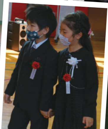
▶ 明倫小学校 2人入学