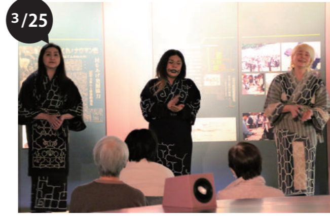
忠類ナウマン象記念館