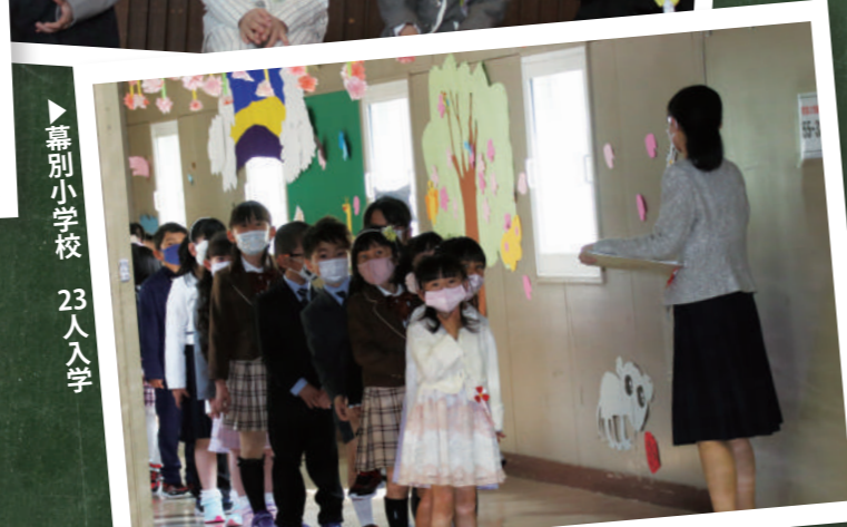
▶ 幕別小学校 23人入学