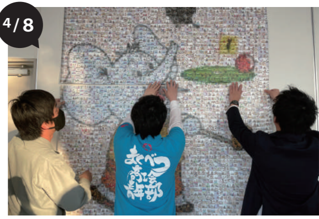
幕別パークプラザ