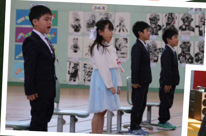
▲ 忠類小学校 5人入学