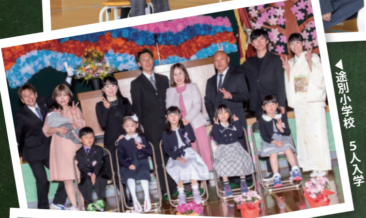
◀ 途別小学校 5人入学