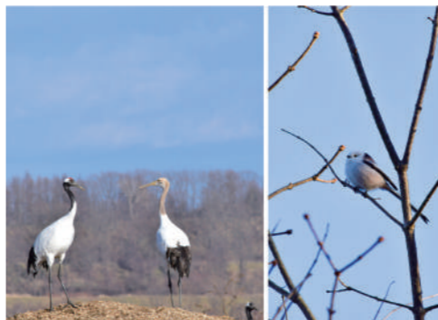
▲たくましく生きる野鳥たち

昨年4月に忠類に移り住み、秋までの活動について12月号の広報まくべつにて報告させていただきました。今回は忠類の自然の美しさについてご紹介したいと思います。