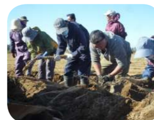
長いもの収穫作業