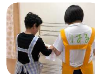
介護アシスタント (洗濯干し・清掃)

随時、広報紙やホームページをとおして体験会や説明会を行います。 興味のある方は、地域産業の応援団として活動してみませんか？