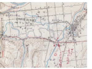
地名調査の記録が書き込まれた、札内～幕別市街地付近の5万分の1地形図