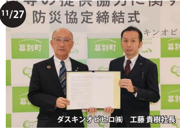
ダスキノビヒロ株式会社との防災協定