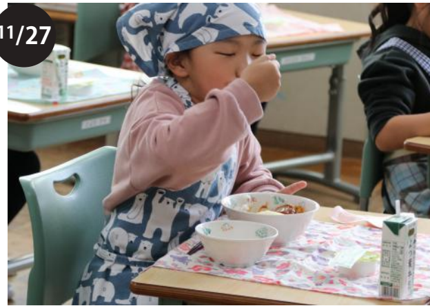
忠類小学校 まくべつの恵み給食