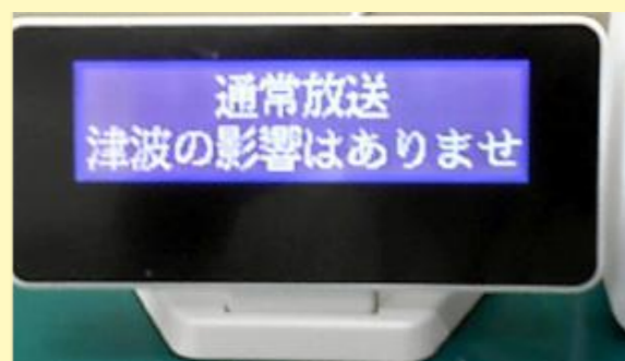
受信情報はテロップ表示で流れます。

戸別受信機では情報が音声で流れます。このため、難聴者の方へ情報を伝えるために、放送内容を文字表示できる機器を無償貸与します。