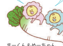
まーくん&めーちゃん

おせち料理におすすめ！ ゆずなどのかんきつ系果物の皮を薄く切って加えると、いい香り★