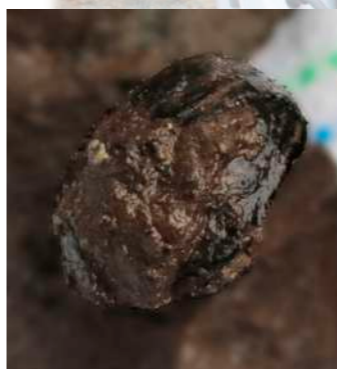
今回の調査でフルミと思われる植物の化石を発見

昨年、一昨年に続いて3年連続となるナウマンゾウ化石骨発掘再調査が10月18日から22日にかけて行われました。 今回の調査は、初めに昨年の再調査時に途中で終わってしまった動物の足跡と思われる荷重痕を詳細に調査し、その後、前回調査より古い時代の地層を調査する予定で始まりました。 調査初日は快晴で天気に恵まれましたが、重機を使って前回調査した地層まで掘り起こしているうちにどんどん水がわき出てきま