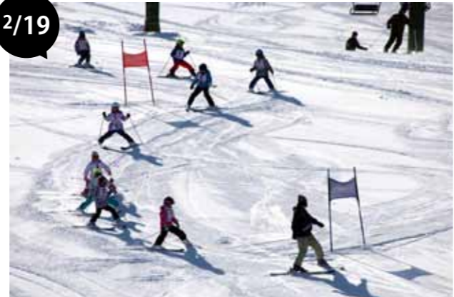
忠類小学校スキー記録会