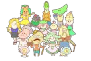
図書館オリジナルキャラクター い〜んかおじさんと仲間たち

幕別町図書館は、令和2年4月で開館30年を迎えます。 30周年を記念するイベントの第1弾として、「読んでみ〜んか?30」を開催します! 「読書通帳」でスタンプを30個集めると、図書館オリジナルキャラクターでデザインされた、30周年限定の利用者カードと交換します。(カードは1人1回のみ)の交換)他にも30周年記念イベントを開催します。 日 4月1日(土)～5月31日(日) 所 図書館本館、札内分館、忠類分館