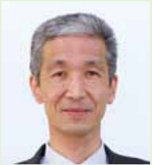
教育長 菅野 勇次

このため、私は、令和2年度を「行政改革元年」として位置付け、各種事務事業の費用対効果の見える化を図る手法として、事務事業評価制度の導入について準備を進めるとともに、町民負担の均衡と受益者負担の原則に立った使用料等の在り方の検討に着手し、持続可能で健全な行財政運営の構築に向けた改革の取組を進めてまいります。