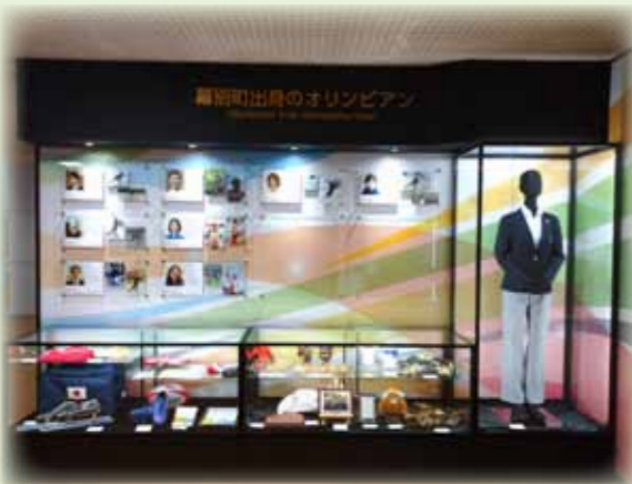
▲農業者トレーニングセンター