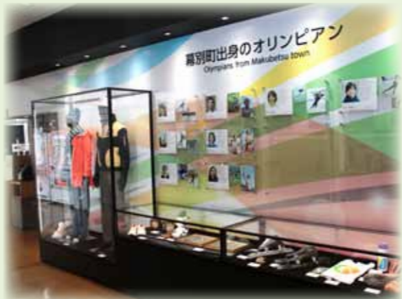
▲札内スポーツセンター