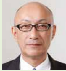
町長 飯田 晴義

人口減少が進行する中、幕別町が持続的に発展していくためには、あらゆる分野にわたって、前例にとられない新たな発想と行動が必要であると考えております。