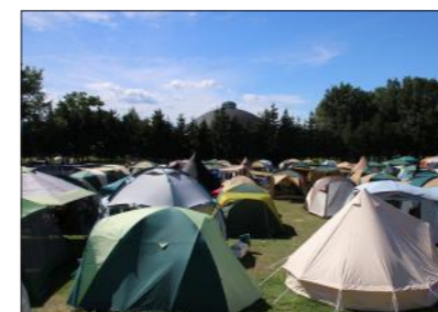
▲「所狭しとテントが立つキャンプ場」