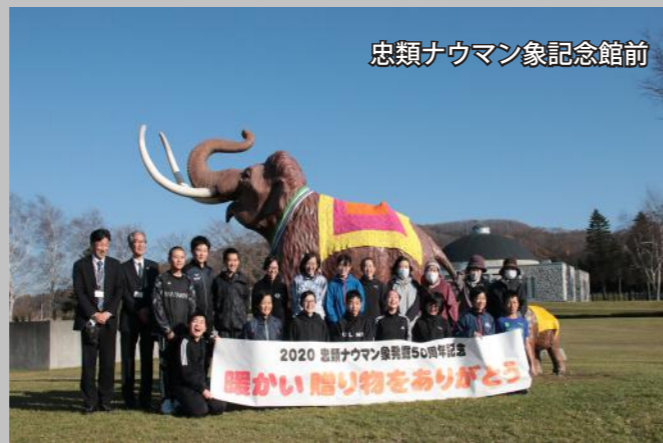
忠類ナウマン象記念館前