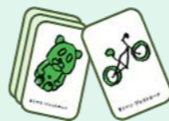
▲まくべつプレストカード

※まくべつプレストカードとは、集団で自由度の高いアイデアを出し合うため幕別町にちなんだキーワードが絵で描かれたカード