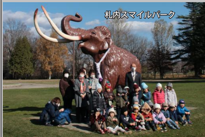
札内スマイルパーク