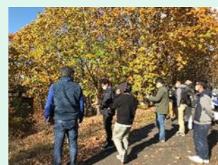
紅葉もキレイでした!