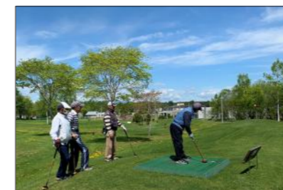
▲「パークゴルフを楽しむみなさん」

そんな素晴らしい施設も今年度は11月3日をもって閉鎖されました。子ども達の笑顔や歓声。混み合っていた公園やキャンプ場の賑わい。それらが無くなり、人影のない公園を目にする度に寂しい気持ちになってしまいます。そんな時には、「みなさん、来年お会いしましょう。また素敵な話をお聞かせください。」とつぶやいています。