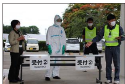
▲「避難所の受付はこちらです」 (忠類総合支所入口にて)