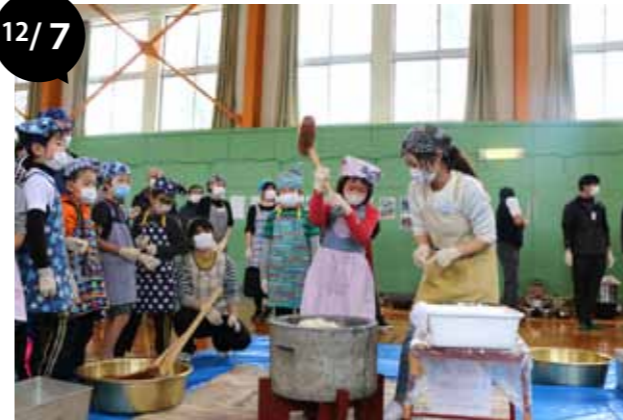
途別小学校もちつき集会