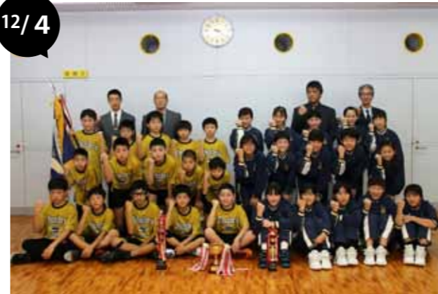
北海道ミニバスケットボール大会出場