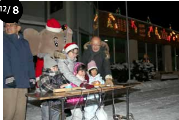
イルミネーション点灯式