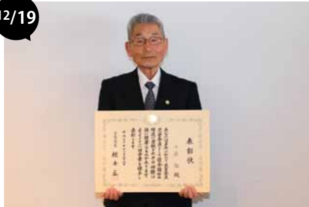
厚生労働大臣表彰