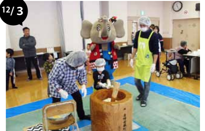
ふれあいもちつき大会2018