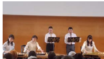
昨年のコンサートの様子

新春を彩る、箏・尺八・三味線の演奏をご堪能ください。なお、休憩時には無料の薄茶・甘酒をご用意してお待ちしております。