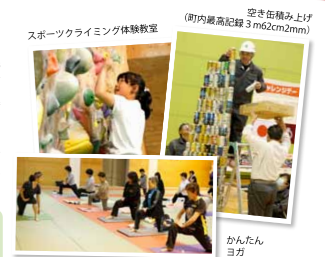
スポーツクライミング体験教室