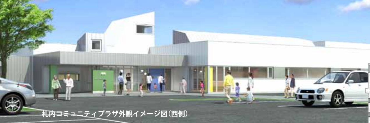
札幌コミュニティプラザ外観イメージ図(西側)