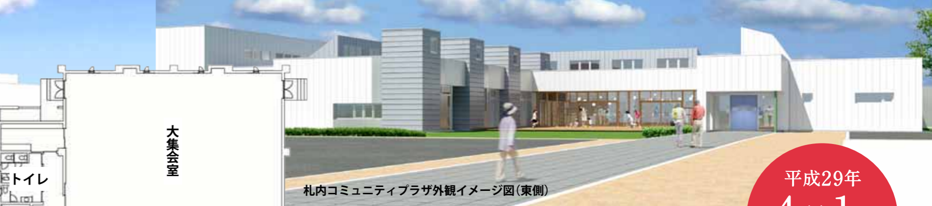
札幌コミュニティプラザ外観イメージ図(東側)