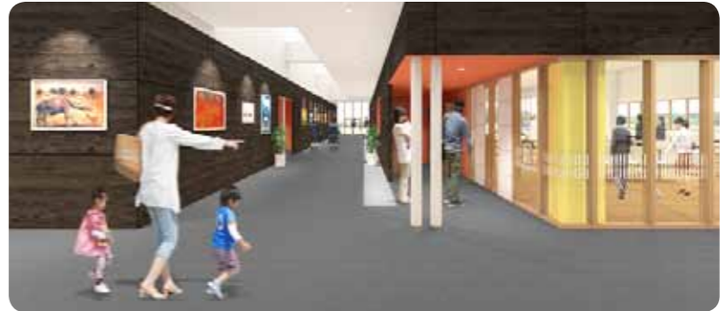
南北通路から見たギャラリー、集会室のイメージ図