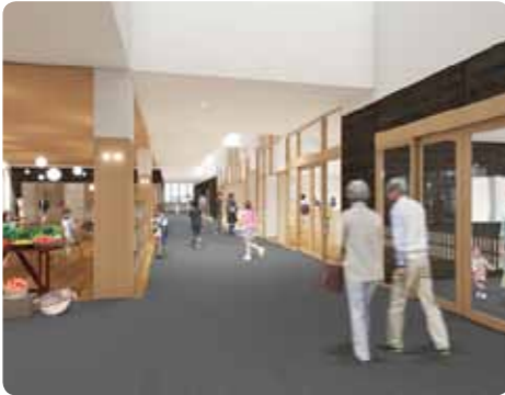
エントランスホールイメージ図