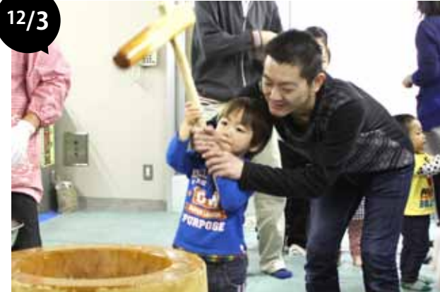
ふれあいもちつき大会2016