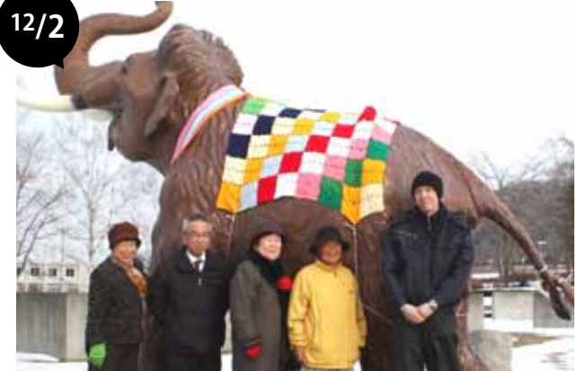
ナウマン象親子像、冬仕様に