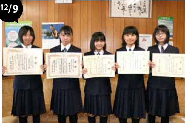
第50回「中学生の税についての作文」入賞