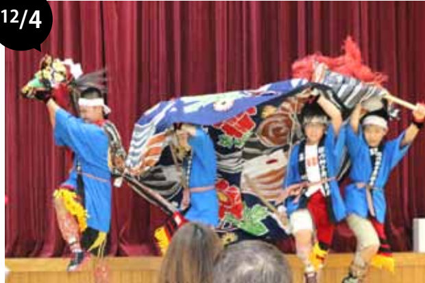
糠内・駒島合同公民館まつり