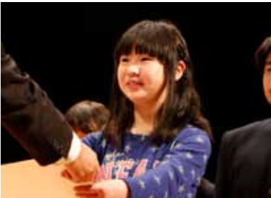
3月20日に、百年記念ホールで「善行賞」として表彰されます。

町内の住宅・建築物の計画的な耐震化を図るため、平成21年に「幕別町耐震改修促進計画」を策定し、地震防災マップの作成、木造戸建て住宅無料耐震診断などの取り組みを行ってきました。この計画を見直し、平成28年から平成32年にかけて取り組む新たな「幕別町耐震改修促進計画(案)」に対する意見を募集します。