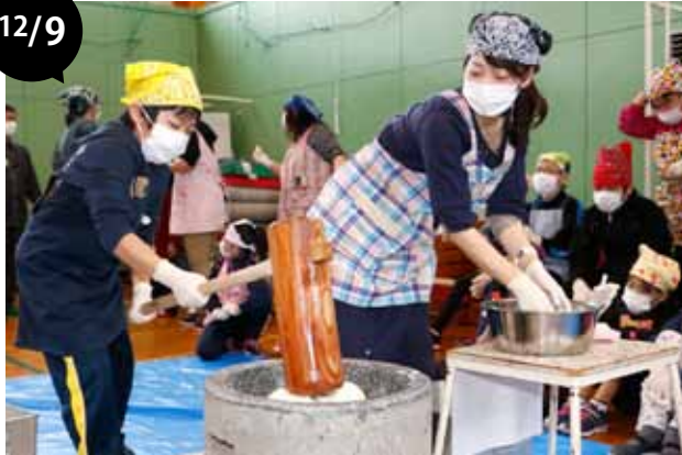
途別小学校もちつき集会