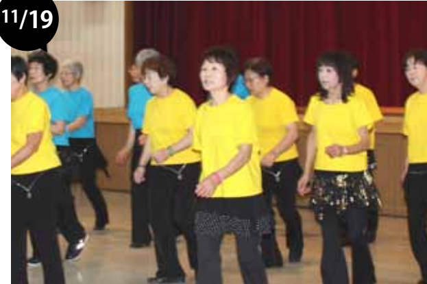
忠類芸能チャリティショー