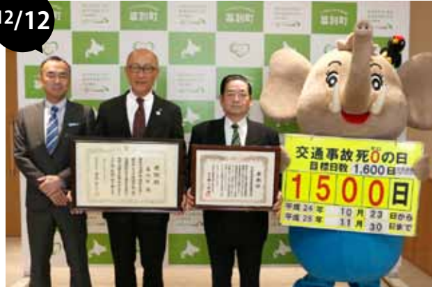
目指せ交通事故死ゼロ最長記録