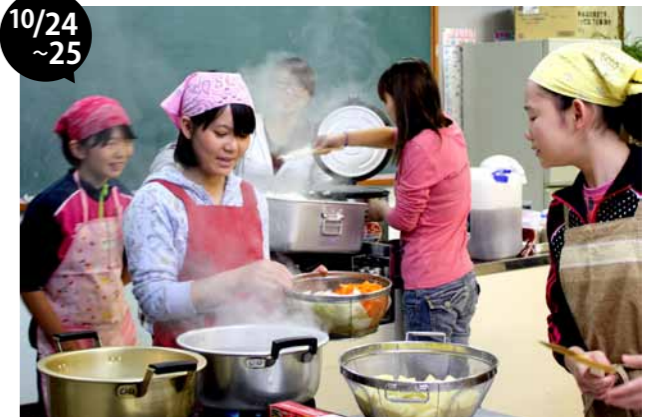
防犯ミニスポーツ大会