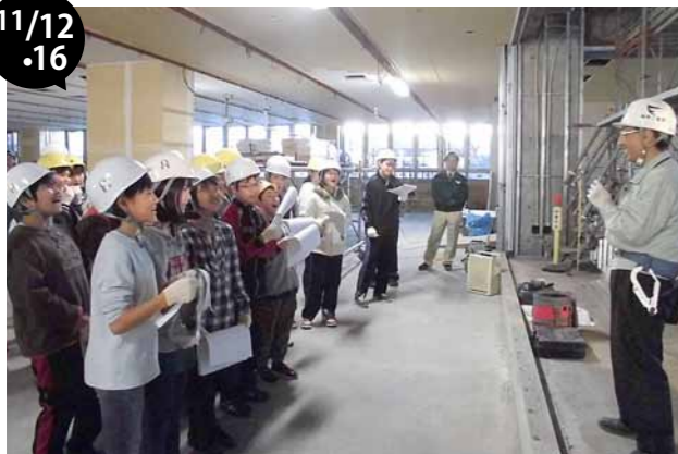
新庁舎建設工事現場見学