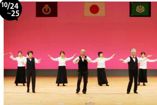
幕別町しらかば大学大学祭