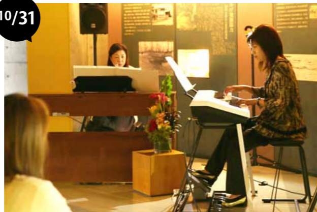
ナウマン象記念館コンサート