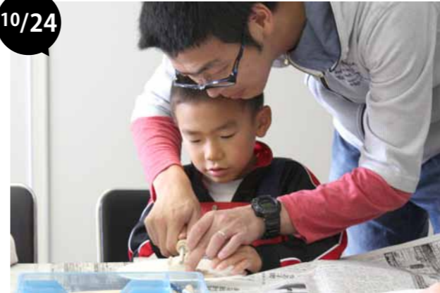
親子でミニ発掘体験教室