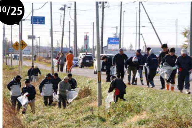
秋の全町一斉クリーン作戦