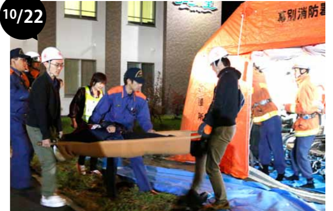
介護老人福祉施設コムニの里まくべつ避難訓練