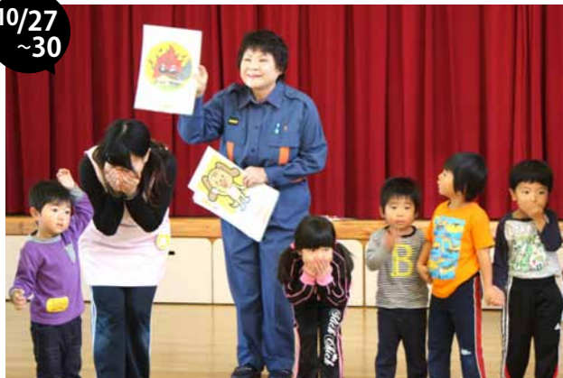
幕別消防団保育所防火訪問