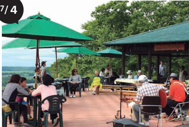
シーニックカフェちゅうるいオープン