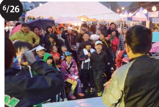
忠類チョマナイかいフェスティバル