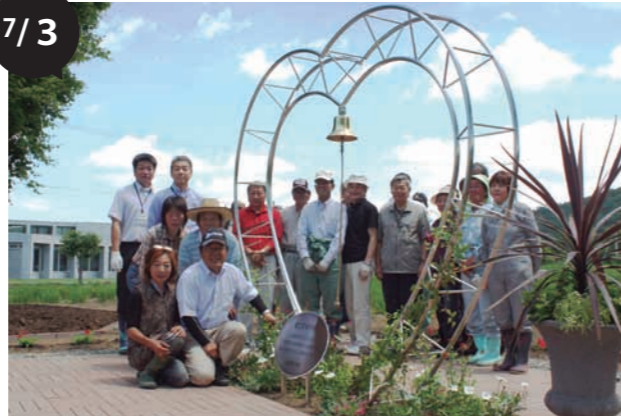
道の駅・忠類 花壇整備