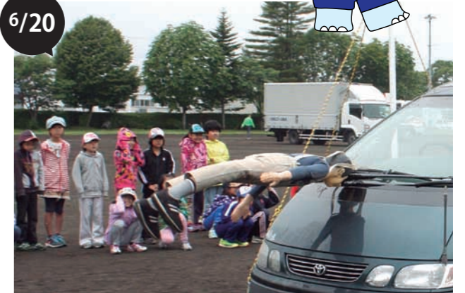
忠類小学校交通安全教室