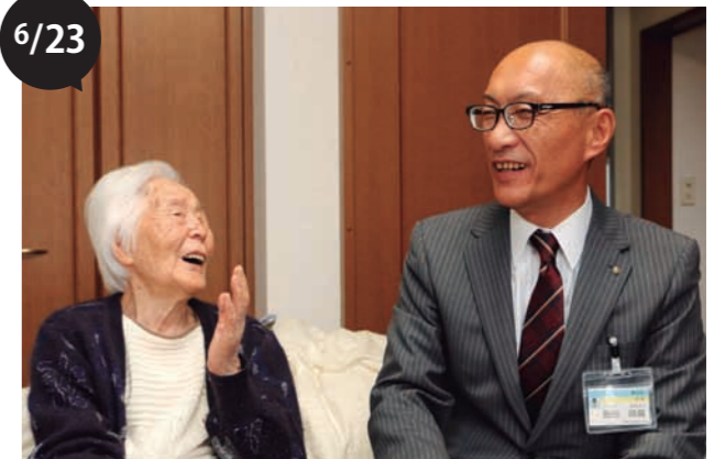
満100歳のお祝い訪問