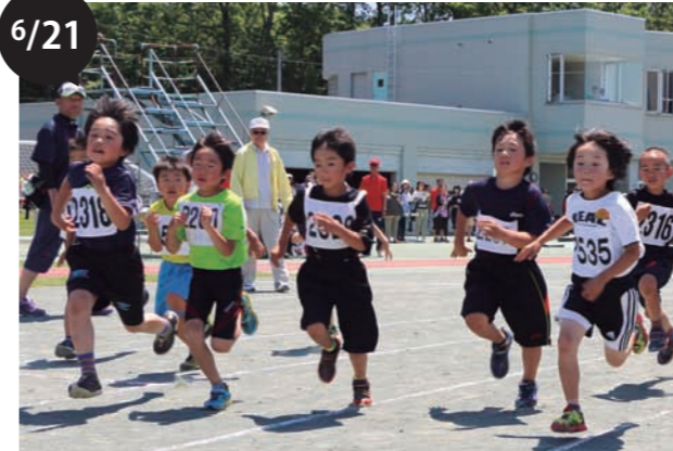
第40回幕別町陸上競技記録会