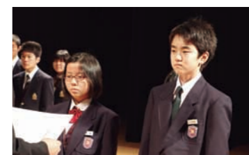
▲平成26年度善行賞の表彰式