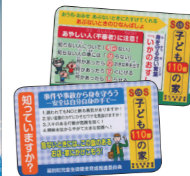
▲防犯カード(小学生用、中学生用)