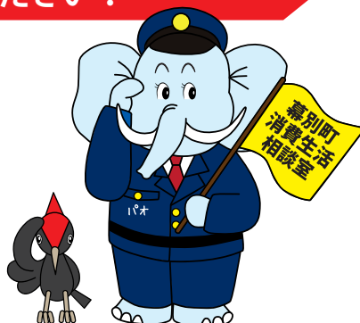
町のマスコットキャラクター パオくん クマゲラクン