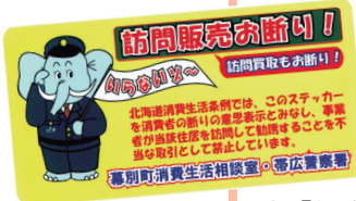
▲「訪問販売お断り」ステッカー

特に、相談が多い50～80代の方は、「自分は詐欺師や悪質商法に狙われているかもしれない」と日ごろから意識すること、おかしな電話や勧誘には即答しないことが大事です！「何か変だ」と感じたら、すぐにご相談ください。トラブル発生からの期間が短いほど、解決できる可能性が高くなります。