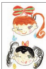
PN. 水戸黄門の農家のお母さん