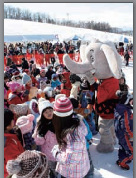
▲子どもたちに人気のパオ君