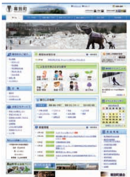
▲新しい町のホームページ

新しいホームページでは、スマートフォンへの対応や、外国語(英語、韓国語、中国語(2種))に翻訳する機能を設置したほか、災害時には、災害情報の発信を行い、大規模な災害時には、通信環境の悪化に備え、ホームページ上の画像や不要な情報を無くした軽いホームページに切り替える機能を導入しました。