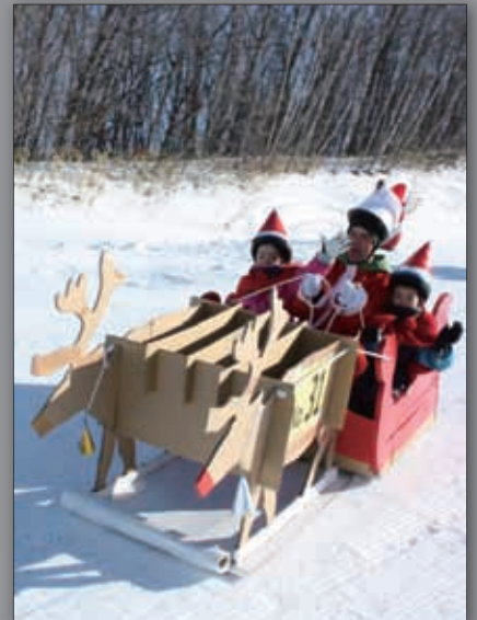
▲のんびり帰宅中のトナカイ号