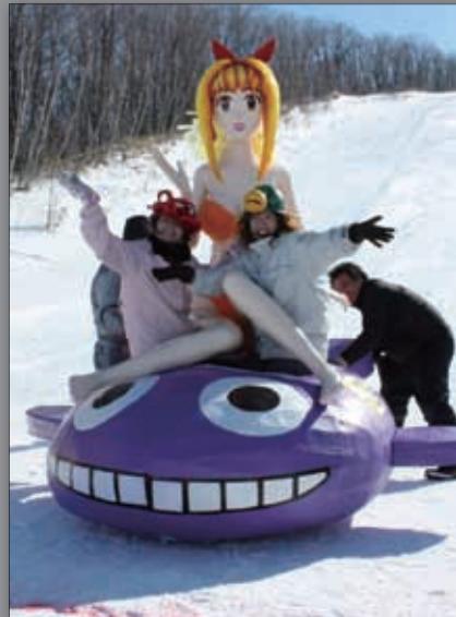
▲マリンちゃんそりにのる！ (グッドデザイン賞1位)