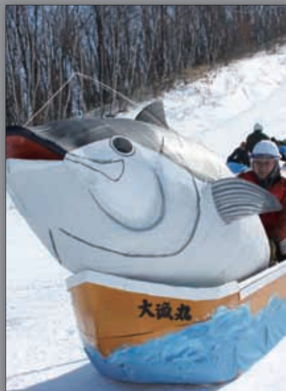
▲マグロー一本釣り (グッドデザイン賞3位)