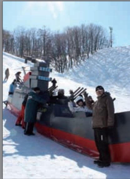
▲ウッ！ちゅうるい戦艦ヤマト (グッドデザイン賞2位)