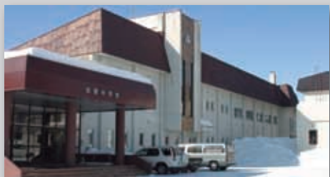
▲現在の忠類中学校

開拓の鉤が忠類に振りおろされたのは、今から120年前の明治27年。大樹村から分村し、忠類村となったのが昭和24年。それから遡る2年前の昭和22年に教育基本法、学校教育法が制定され六三制といわれる新学制度が実施されました。この年、大樹村立忠類中学校として忠類小学校に併設するかたちで開校され、114人の生徒が在籍していました。開校当時は、教室不足のため小学校や役場庁舎として予定されていた公民館などで授業が行われていました。昭和30年代までは生徒数が増加し、200人以上在籍していた年もありましたが、時代の変遷とともに生徒数が減少し、現在は生徒数48人。これまでに2923人の人材がこの忠類中学校を卒業しています。