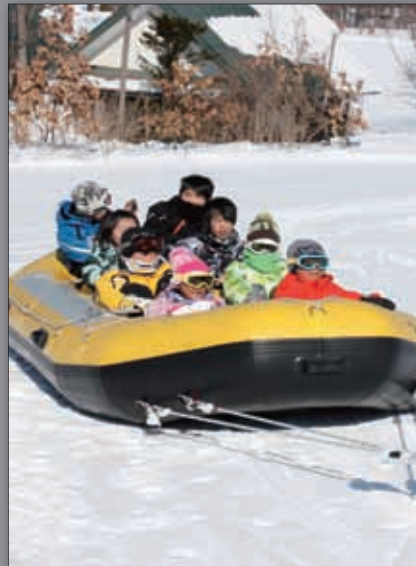
▲スノーラフティング