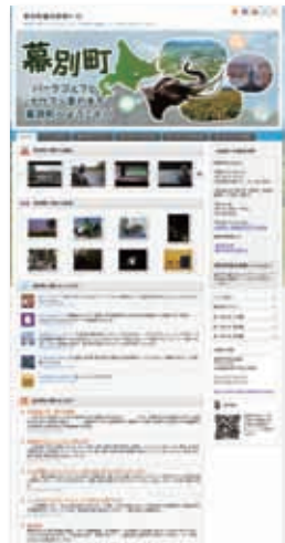
▲幕別町観光情報サイト

インターネット上に存在する、ツイッターやブログ、写真やユーチューブから幕別町の観光に関する情報を自動的に収集し表示する「幕別町観光情報サイト」を開設しました。町内の食べ飲み処も掲載しています。