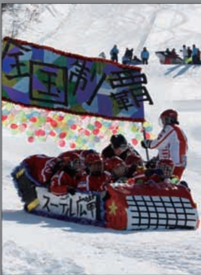
▲スーパーレディース号