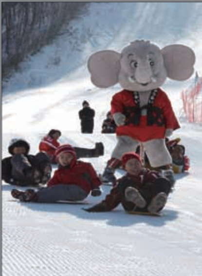
▲開会セレモニーの様子