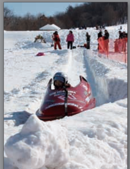
▲子どもボブスレー体験教室