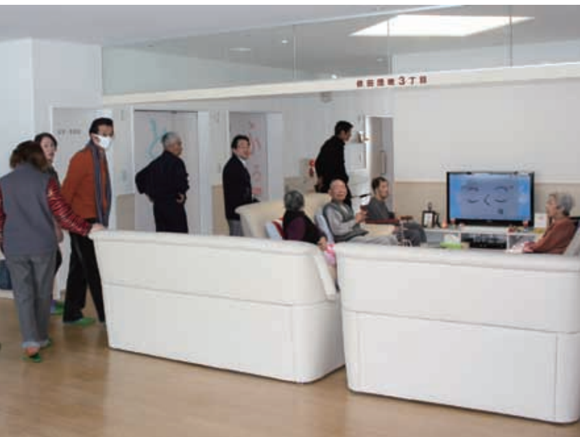
▲実際の入居スペースを見学する参加者（ふらっと札内）

町民を対象に、施設見学や史跡巡りなどをし、町への理解を深める「町民見学会」を2月8日（金）に開催し、18人が参加しました。 この日は、社会福祉法人幕別真幸協会が運営する地域密着型介護老人福祉施設「ふらっと札内」と道内最大級のほうれん草の水耕栽培施設「テクノカ本部」を見学しました。 昨年の6月に開設した地域密着型介護老人福祉施設「ふらっと札内」は、介護の必要なお年寄りが住み慣れた地域で、その地域の現状に適した介護サービスを受けられるように