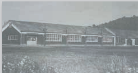
▲開校当時の旧忠類中学校