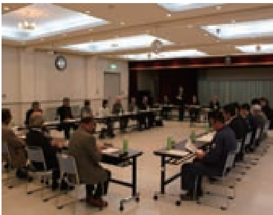
▲幕別町地域公共交通確保対策協議会の様子

プロポーザルに参加表明のあった十勝バス(株)、帯運観光(株)の2者によるプレゼンテーションを実施し、第一次、第二次審査の総合的な評価結果を踏まえ、十勝バス(株)を運行事業者に決定しました。