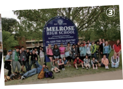
①歓迎集会でよさこいを披露 ②調理実習ではカンガルーの肉を使ったハンバーガー作りに挑戦 ③メルローズハイスクールの生徒たちと校門の前で記念撮影

立動物園を見学。野生のカンガルーやエミューを見つけると、夢中になってカメラのシャッターを押していました。夜にホストファミリーとさよならパーティーが開かれました。研修生はお世話になった感謝の気持ちを英語でスピーチし、みんなで過ごす最後の夜を満喫しました。 滞在5・6日目 ホストファミリーと別れた後、メルボルン市に移動しました。 ビクトリア州議事堂やセントパトリック大聖堂などの歴史ある建造物を見学しました。(翌日帰国)