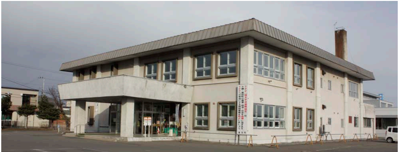
▲札内福祉センター（昭和49年4月に竣工し、平成26年4月で築後40年が経過します。）

◆施設の利用状況は、軽スポーツを行う目的で平日の昼中（午前と午後）に大集会室を利用する団体が多く、利用頻度は、週1回や月数回の単位で2〜3時間での利用が多い