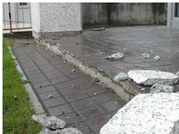
【十勝沖地震発生時の役場】