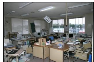
↓役場3階企画室事務所