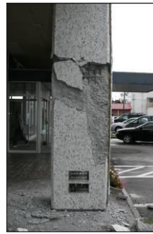
【十勝沖地震発生当時】