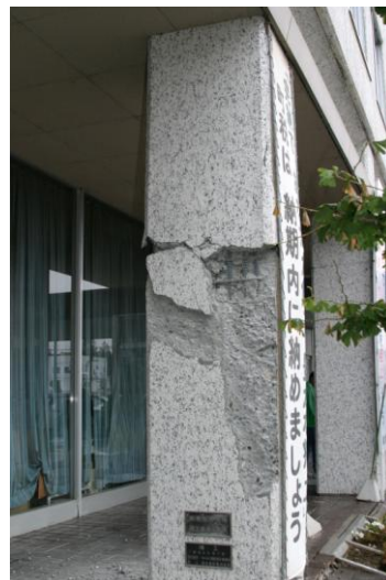
【十勝沖地震発生時の役場】