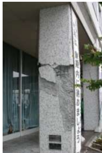
【十勝沖地震発生時の役場】