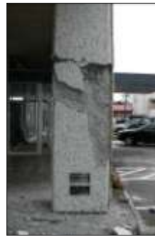
【十勝沖地震発生当時】