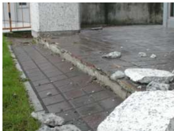
【十勝沖地震発生時の役場】