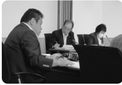
産業建設常任委員会 （陳情の審査 6/14）