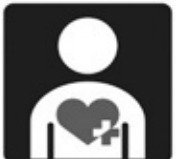
「ハート・プラスマーク」

現在、すべての都道府県で導入されている「ヘルプマーク」は、「ハート・プラスマーク」の役割を包含しているものと捉えていることから、さらに多くの方々に広くマークが認知されるよう、広報紙のほか、SNSなども活用しながら、引き続き「ヘルプマーク」の普及に努めていく。