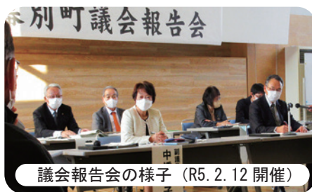
議会報告会の様子（R5.2.12開催）

今回のことを踏まえ、反省し、議論してより良い議会報告会になるように努力してまいります。