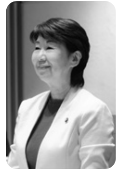
内山美穂子 議員 (拓政会)