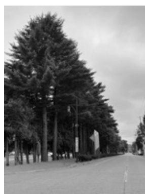
「札内スマイルパーク」西側の街路樹

(2)都市樹木の中には、景観木や地域のランドマークとなっているもの、歴史的価値の高いもの、野生動物植物が生息しているもの等も存在するため、慎重な判断が必要。安全確保を最優先に、地域住民との話し合いや専門業者の意見を聞きながら、個別に対応していきたい。 また、大木化しないよう、簡易で適切な管理方法の導入について研究していきたい。