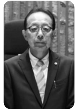
芳滝 仁 議員 (ひまわり)