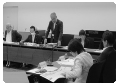
民生常任委員会 （所管事務調査 6/21）

委員からは、新設された停留所の確認や、改正内容の周知について質疑が行われました。