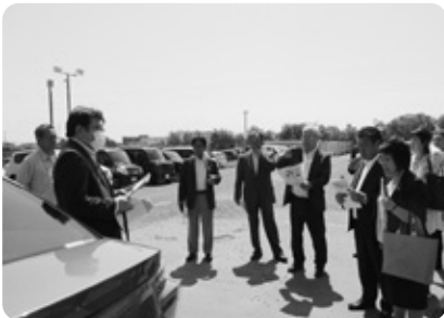
エア・ウォーター株式会社訪問 （7/5）

翌5日は、エア・ウォーター株 式会社（札幌市）を訪問し、移動 式水素ステーションや垂直設置型 太陽光モジュールについて、また、 恵庭市議会にてICT化の取組に ついて研修しました。