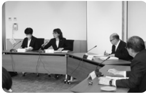
総務文教常任委員会 （陳情の審査 6/14）