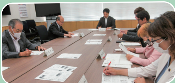
広報広聴委員会（議会だより編集作業）

今年5月8日から新型コロナウイルス感染症の法律上の位置付けが「2類相当」から「5類」感染症に変わり、元の生活に戻りつつありますが、これまでの約3年間は新型コロナウイルス感染症の影響によって、思うような活動ができず、試行錯誤の期間でもありました。