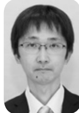
荒 貴賀 札内若草町 政党役員 日本共産党 幕別町議員団