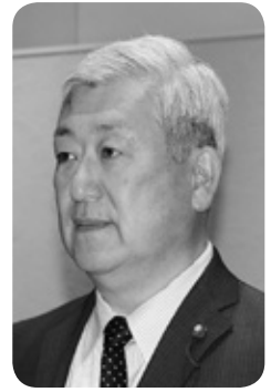
谷口 和弥 議員 (拓政会)