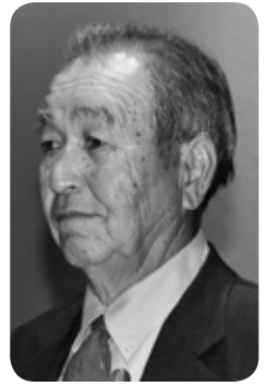
藤原 孟 議員 (無党派)