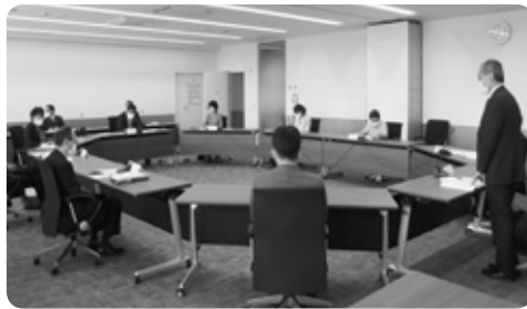
幕別町商工会との意見交換会

力しながら方向性を見いだしたい。 ・町内限定のデジタル通貨実施に向け検討している。観光客にも使えるような仕組み、行政ポイント、ボランティアポイントなどを町で付加する方法も検討している。 ・コロナ融資の償還が来年の5月から始まるが、経済がコロナ前に戻っているわけではないので不安だという声がある。