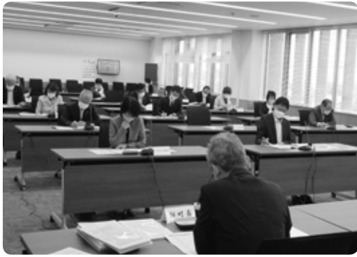
全員協議会の様子

6月24日、全員協議会を開催しました。 令和3年度をもって解散(清算)した株式会社忠類振興公社の昨年度の事業報告、決算状況報告と解散に至るまでの経過、解散および清算のスケジュール等について説明を受けました。 また、十勝ブランドの認知度向上を図ることを目的として、十勝町村会で導入に向けて取り組んでいる「図柄入りご当地ナンバープレート」について、防災環境課から説明を受けました。