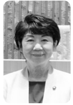
内山美穂子 議員 (拓政会)