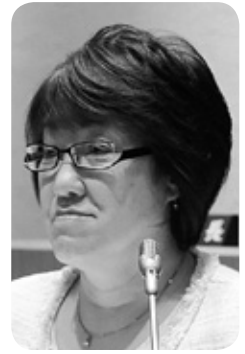
岡本真利子 議員 (政清会)