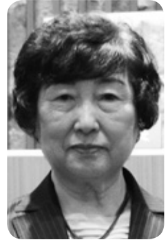
野原 恵子 議員 (日本共産党 幕別町議員団)