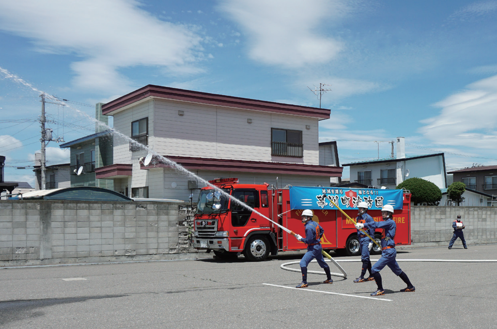
幕別町消防団第1分団ポンプ操法 訓練披露