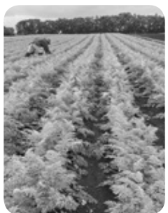
給食用オーガニック人参畑 (十勝管内)

有機農産物は環境負荷低減や高収益作物として位置付けている。まずは、消費者に有機野菜のおいしさ、あるいは環境負荷が少ないことなど理解してもらおう機会を、有機農業に取り組む農業者の協力を得ながら実施できるように検討していきたい。給食の食材については、地場産のものを使いつつ、生産者の協力を得ながらいくらかでも増やしていきたい。