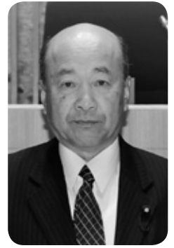
石川 康弘 議員 (拓政会)