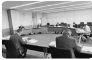
総務文教常任委員会

改訂内容の主なものは、策定から5年経過による時点修正によるもので、今後の使用料や利用料、財源の見直しなどについて質疑が行われました。